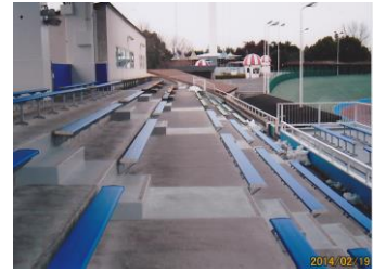
キャプション：観覧席ベンチ取換え