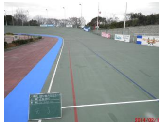
キャプション：400M 走路補修