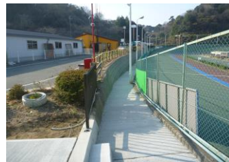
キャプション：連絡通路補修