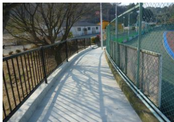
キャプション：連絡通路補修