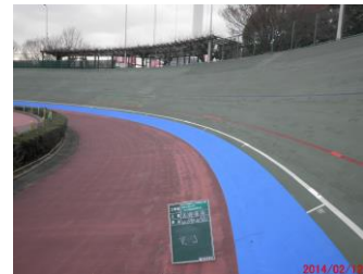
キャプション：400M 走路補修