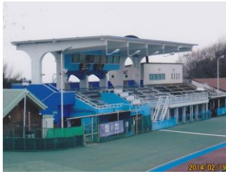
キャプション：観覧席外壁補修