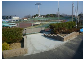
キャプション：連絡通路補修