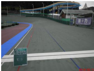
キャプション：400M 走路補修